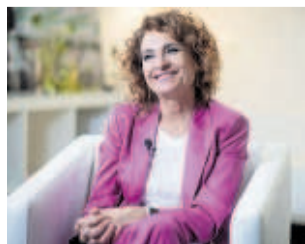
María Jesús Montero.