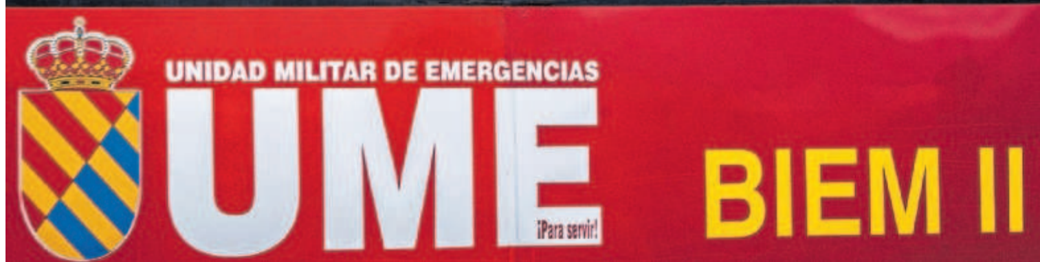
Uno de los pasajeros evacuados del barco saludaba ayer desde un autobús de la Unidad Militar de Emergencias. MIGUEL VELASCO