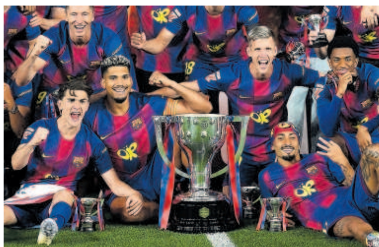
Los jugadores, anoche con el trofeo de Liga.

Hansi Flick, un culé con los ojos de Cruyff