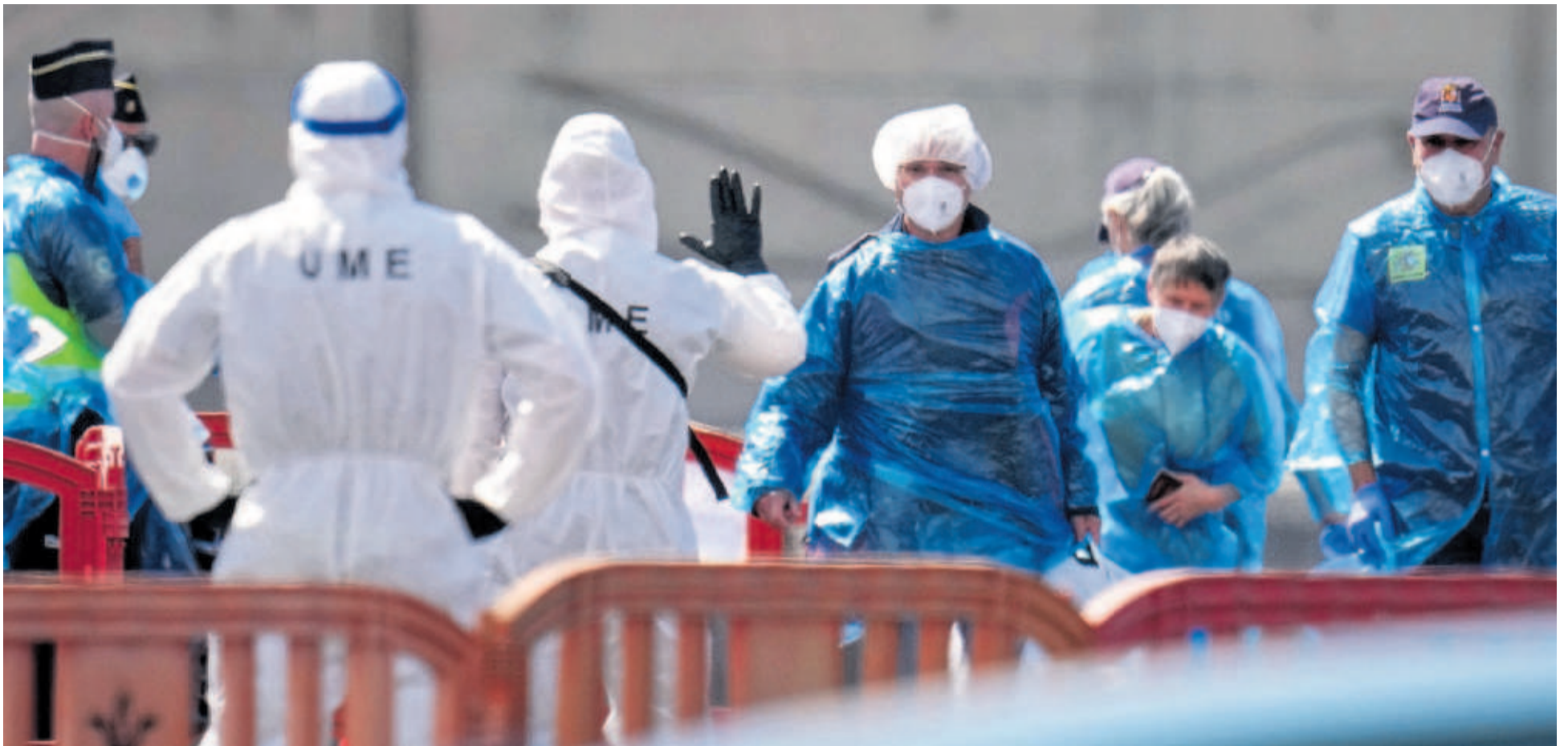
Un grupo de pasajeros del crucero desembarcaba ayer en el puerto tinerfeño de Granadilla en presencia de la UME.