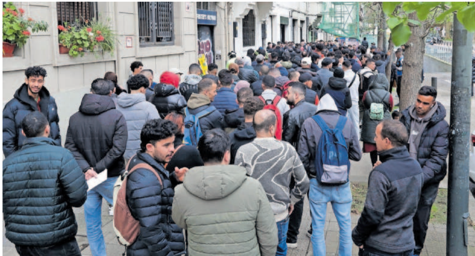
Colas de inmigrantes ayer en el Consulado de Marruecos en Bilbao.

proceso de carecer de antecedentes penales en su país de origen. Las ONG lamentan no haber recibido por adelantado información más minuciosa sobre los trámites a realizar y aguardan con expectación los detalles. —P14 A 17