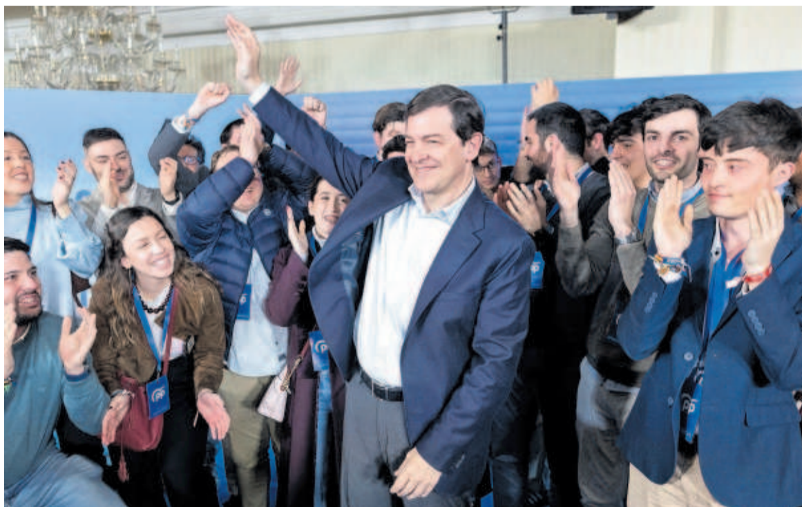
Alfonso Fernández Mañueco celebraba anoche en Salamanca la victoria en las elecciones.