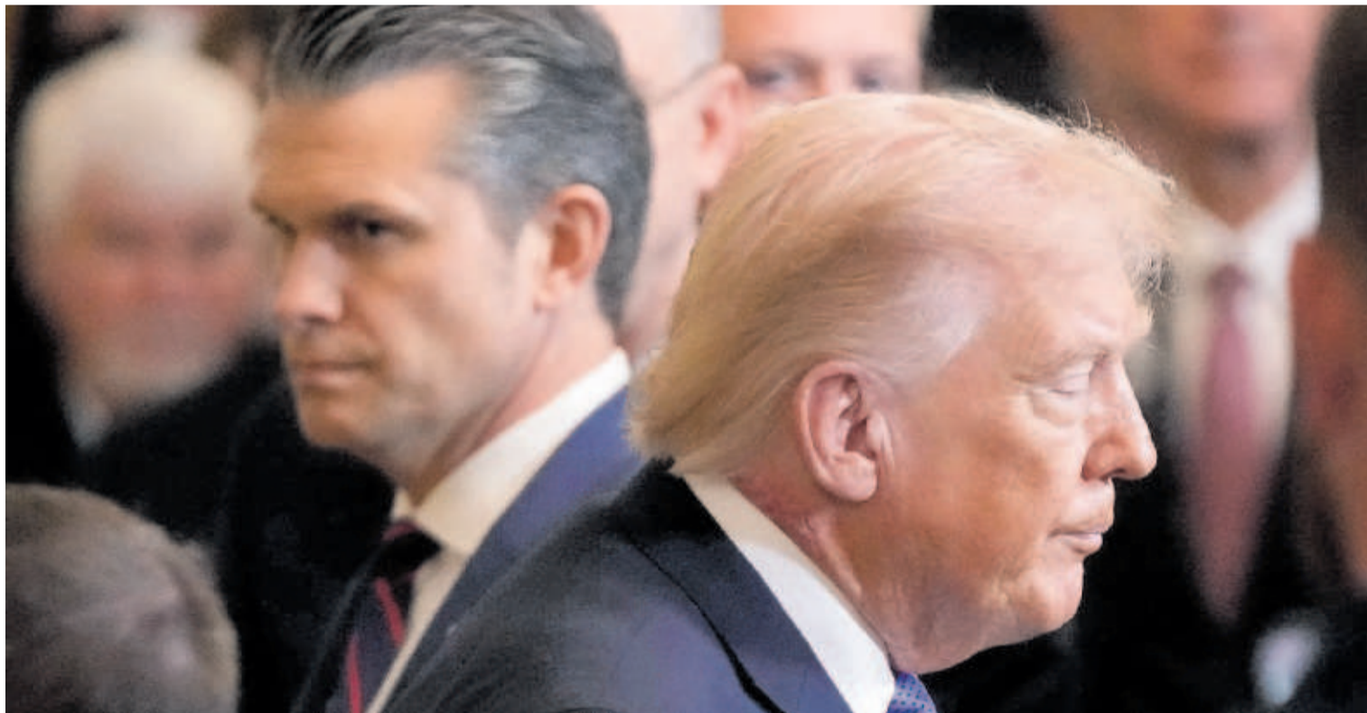
Donald Trump, junto al secretario de Defensa, Pete Hegseth, ayer en Washington.