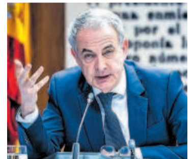
José Luis Rodríguez Zapatero.

rá "injustificados" los ataques. El influyente senador republicano Lindsey Graham acusó a España de ignorar "el sufrimiento del pueblo iraní". "Espero que el actual Gobierno sea una aberración y no la norma", añadió. —P18 Y 19