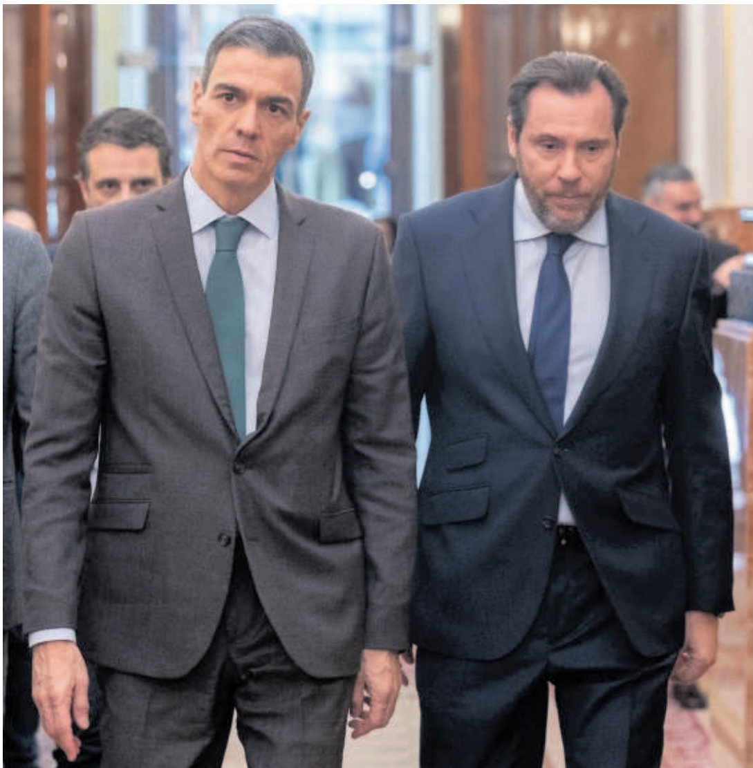
Pedro Sánchez y Óscar Puente, ayer en el Congreso.