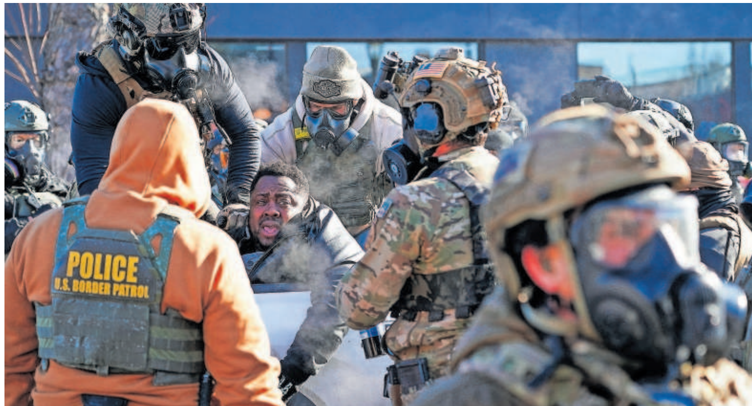
Agentes federales se llevaban ayer a un manifestante herido en las protestas de Minneapolis contra la violencia policial.