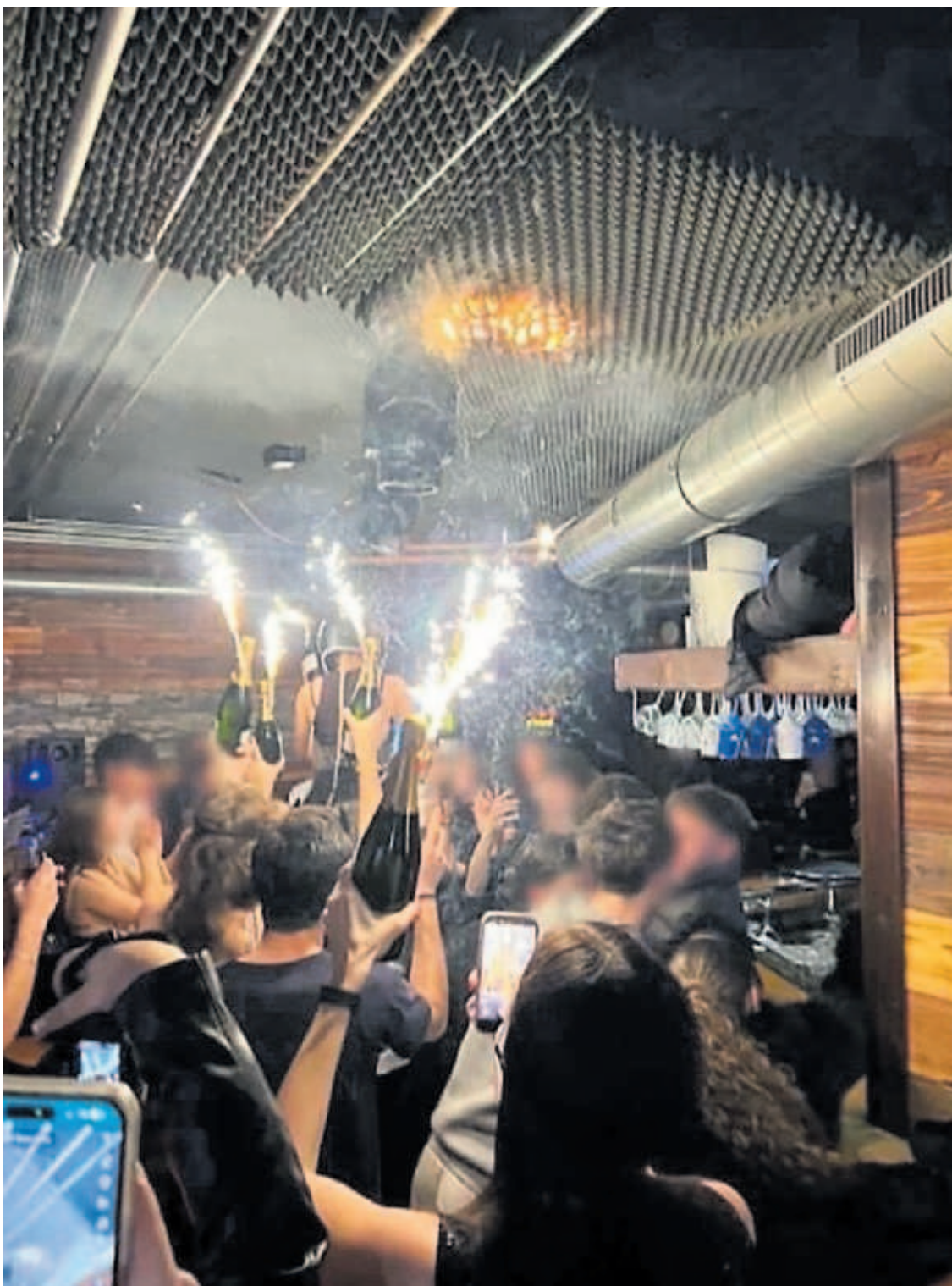
Una captura de vídeo del momento en el que supuestamente comenzó el fuego en el bar suizo.