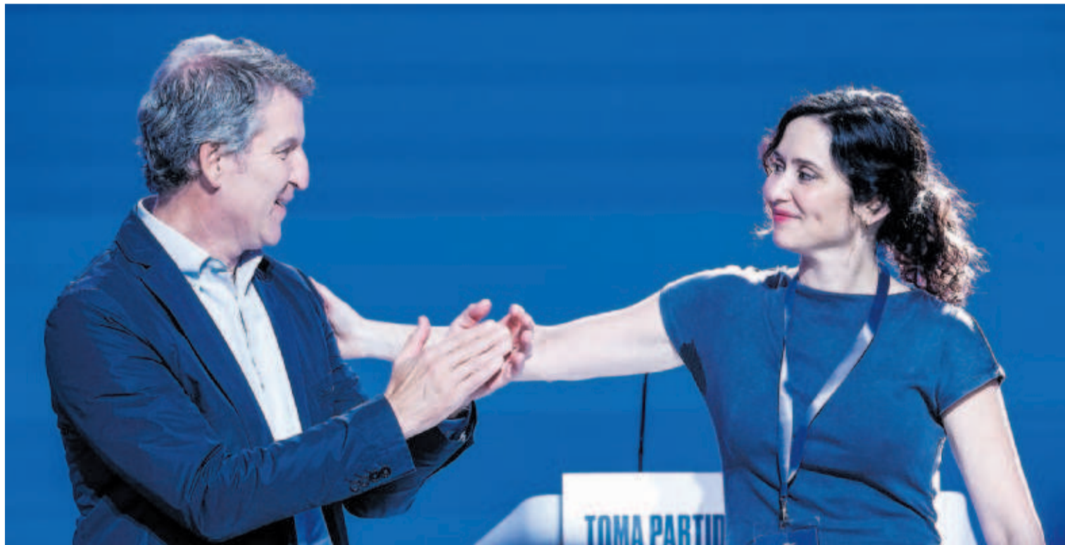
Alberto Núñez Feijóo aplaudía ayer, antes de su propia intervención, el discurso de Isabel Díaz Ayuso.