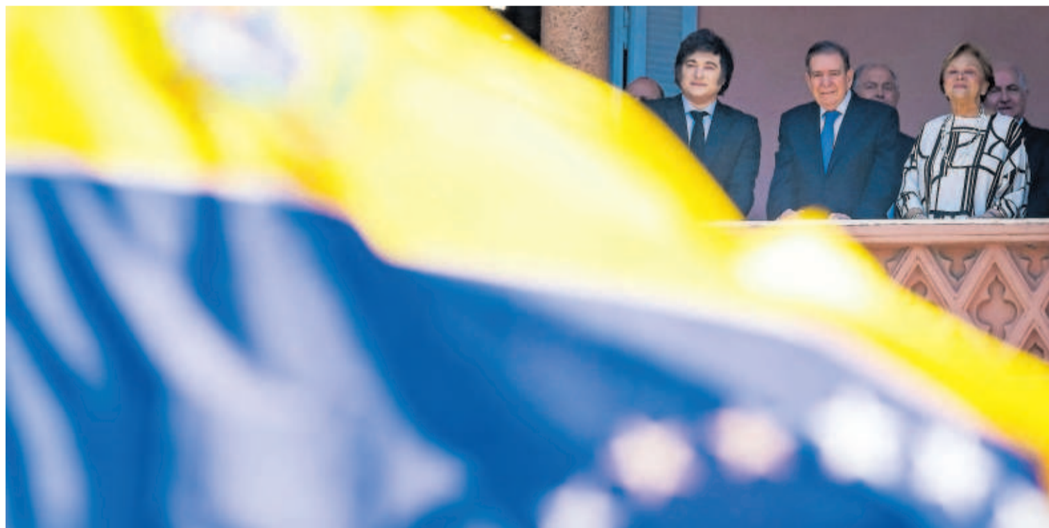
M. ENDELLI (GETTY)

Edmundo González con Milei, antes de la disputada toma de posesión