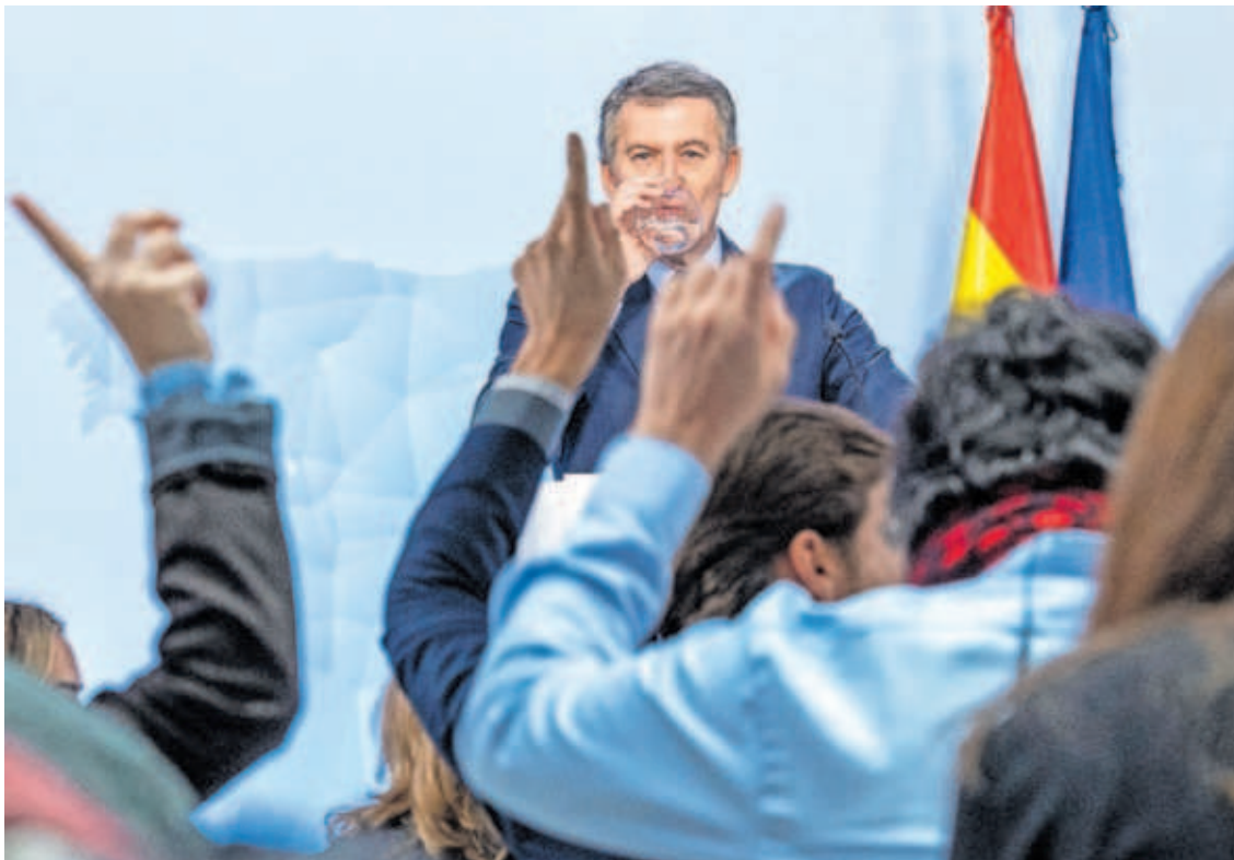
Alberto Núñez Feijóo realizaba el balance político del año 2024, ayer en Madrid.

El juez deniega la cautelar al Barça, que no podrá inscribir a Dani Olmo —P35