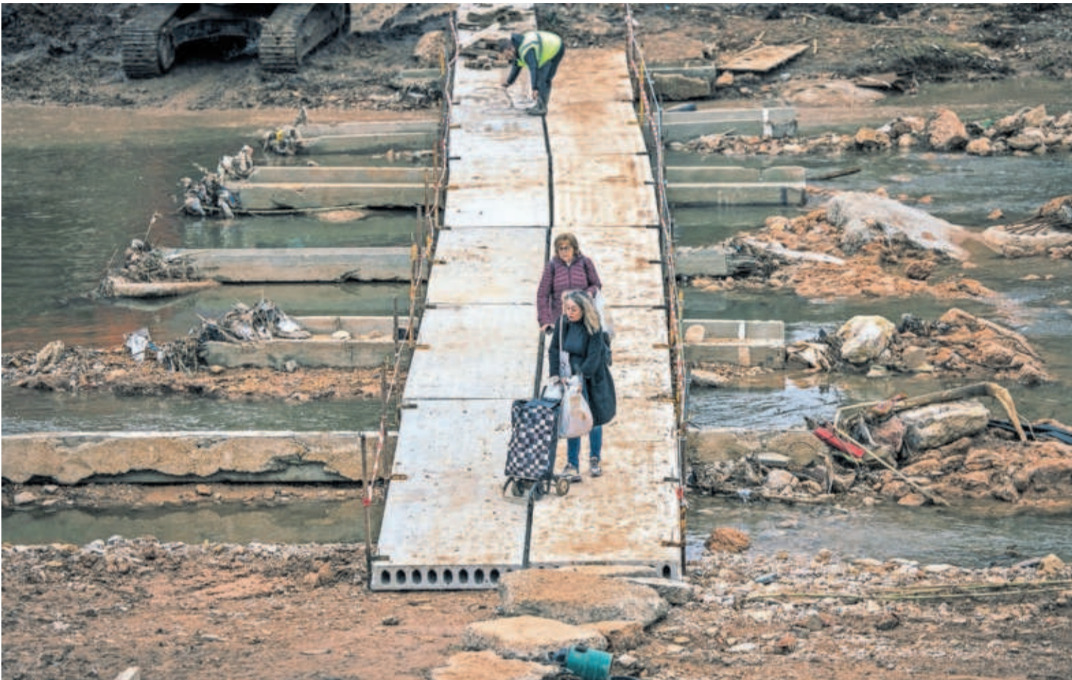
Pasarela construida en el barranco del Poyo por los vecinos para comunicar distintas zonas de Picanya, ayer. ÓSCAR CORRAL

Especial Gastro: del 'pa amb tomàquet' a la ruta del ramen en Tokio