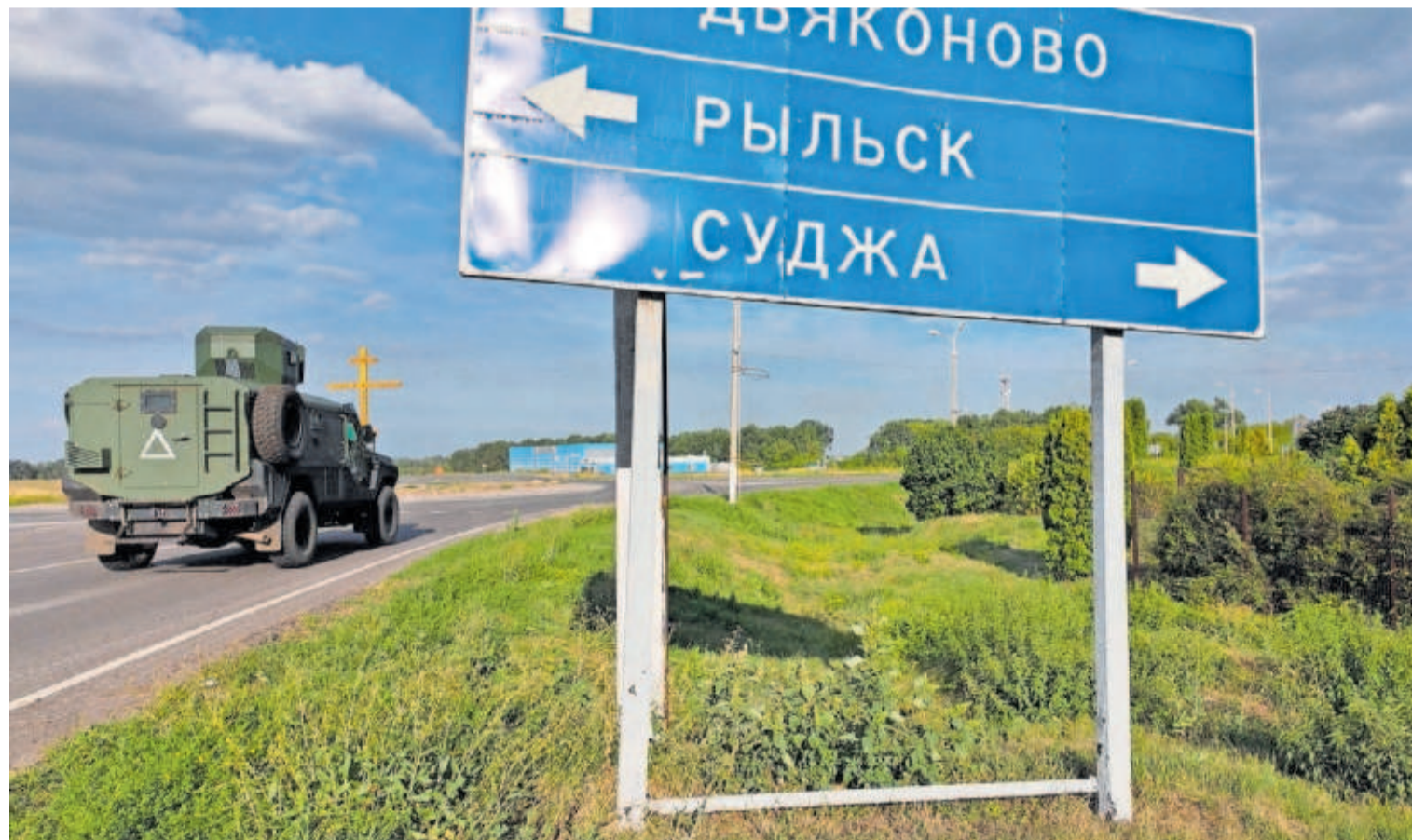
Un blindado ucraniano circula junto a un cartel que indica la dirección a Sudzha (Rusia), principal municipio conquistado por los ucranianos. c. s.