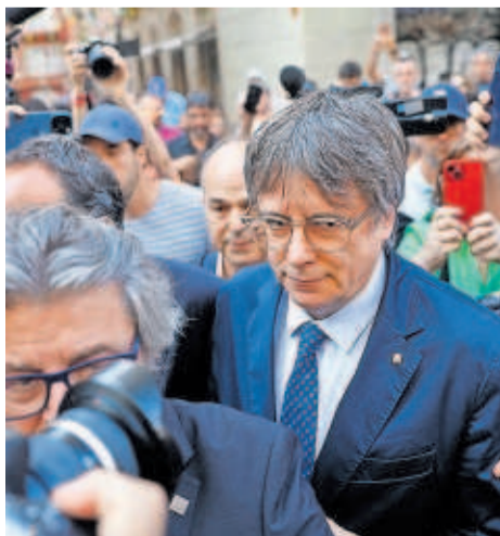
Puigdemont, ayer en Barcelona.

Puigdemont, el hombre que por la mañana había dejado en evidencia a los Mossos d'Esquadra y cuyo partido, Junts, trató de suspender la sesión en dos ocasiones. “Cataluña necesita abrir una etapa de consensos puertas adentro y puertas afuera”, dijo Illa. Los desafíos son múltiples. —P14 A 19