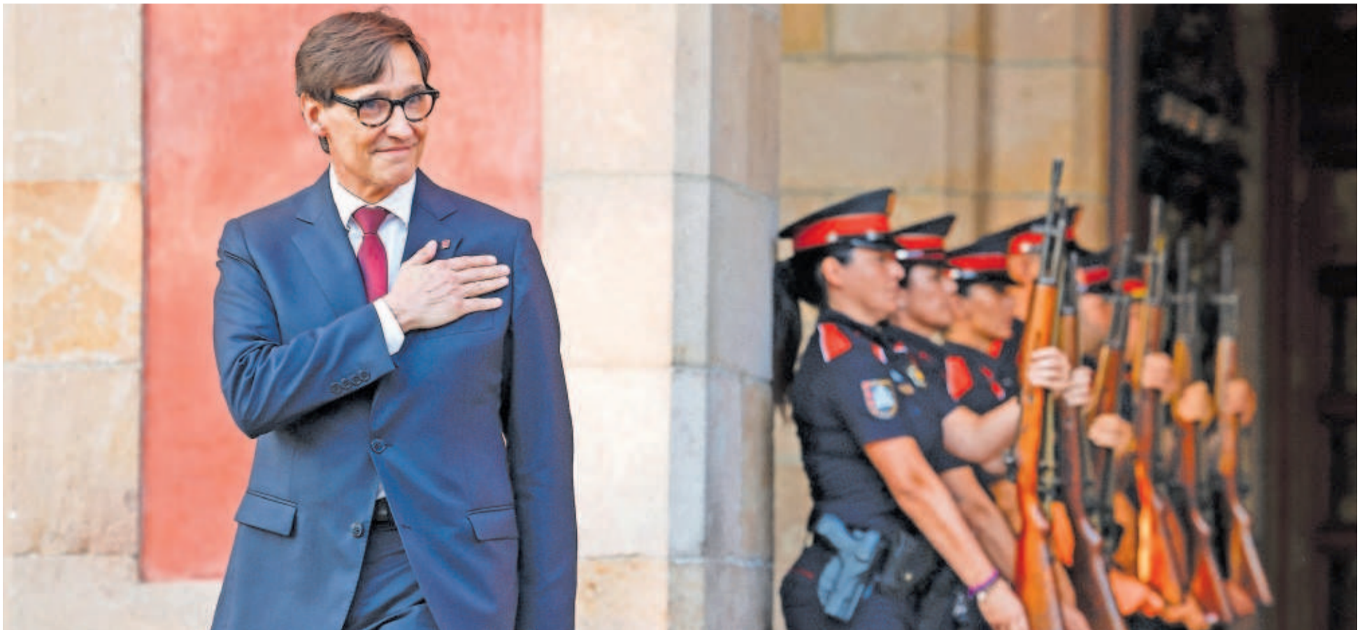
Salvador Illa pasaba revista a los Mossos d'Esquadra, ayer en Barcelona tras el pleno en el que fue investido president de la Generalitat.

El piragüismo suma otros dos bronce al medallero —P30 A 38