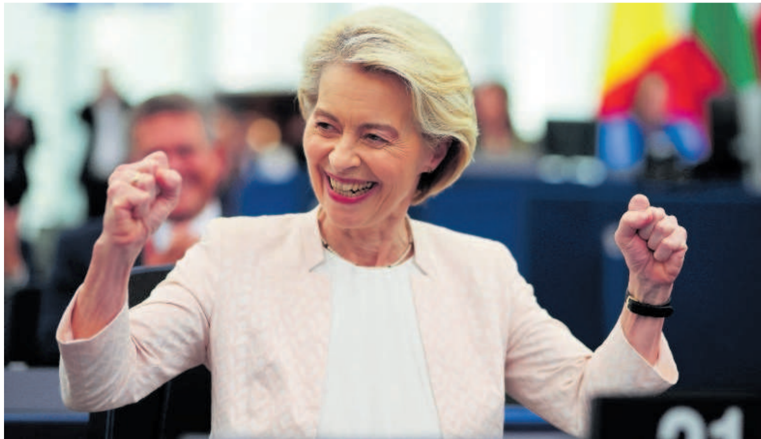
Ursula von der Leyen celebraba el resultado de la votación, ayer en el Parlamento Europeo.

Casi todo el país afronta hoy una jornada de temperaturas extremas, que se aliviarán mañana