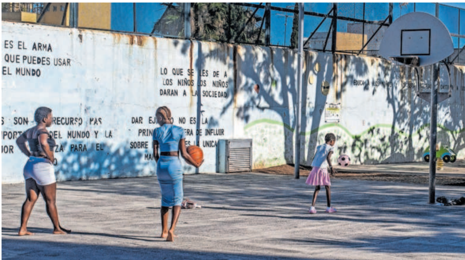
Tres menores migrantes de un centro de acogida, ayer en Santa Cruz de Tenerife.

El lagarto canario, en peligro por las serpientes invasoras —P34