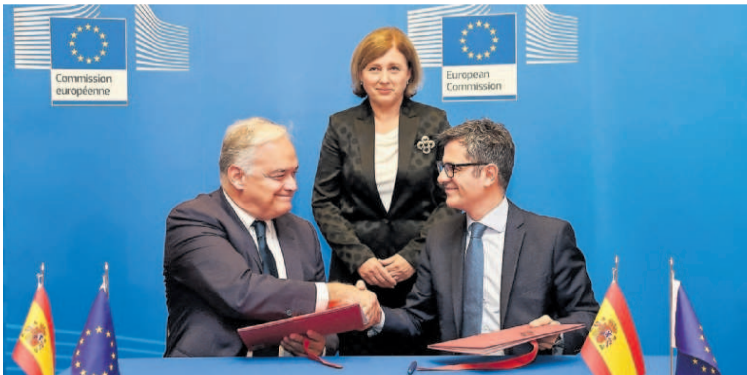
Esteban González Pons, Vera Jourová y Félix Bolaños, tras firmar el acuerdo, en una imagen de la Comisión Europea.

● La larga parálisis del órgano había sumido en la precariedad a los tribunales