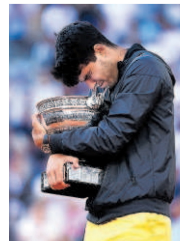
Alcaraz, con el trofeo.

Grand Slams, y además en distintas superficies. Ayer se impuso a Alexander Zverev en la final de París con un juego desbordante, incontenible, que le sirvió para remontar la ventaja que le sacaba el alemán después del tercer set: 6-3, 2-6, 5-7, 6-1 y 6-2. —P36 A 39