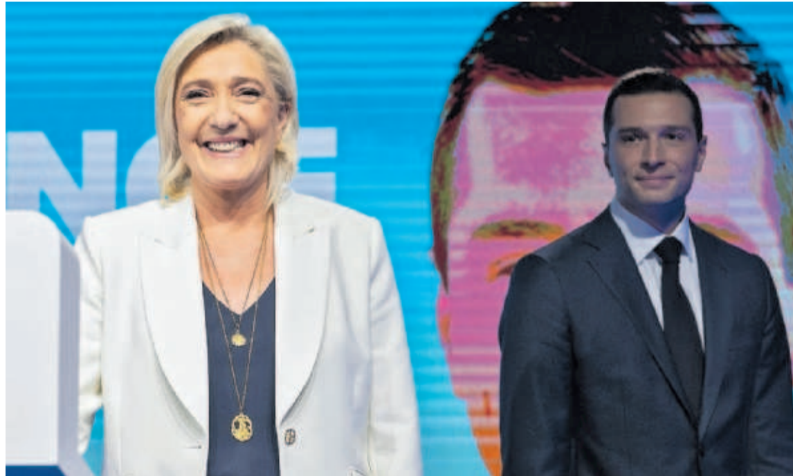
Marine Le Pen, anoche con el candidato de Reagrupamiento Nacional, Jordan Bardella.

Avance ultra en la UE... y la excepción ibérica — EDITORIAL EN P14