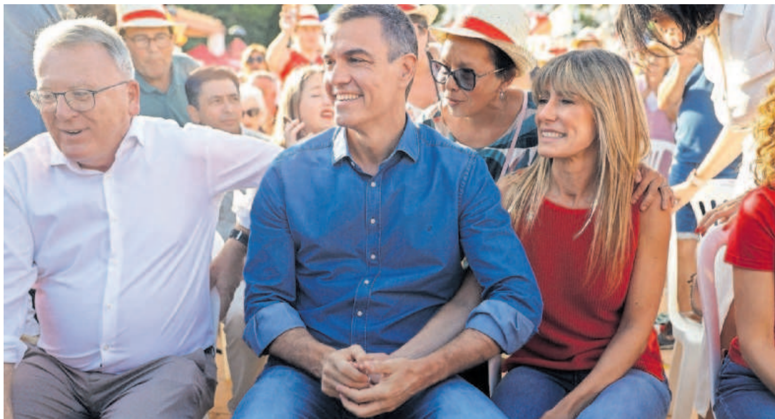
Sánchez y Gómez, ayer en Benalmádena (Málaga) con el candidato socialista a presidir la Comisión, Nicolas Schmit.

PJ Harvey: “Me sentía perdida. Me pregunté si tomar otro camino” —P41