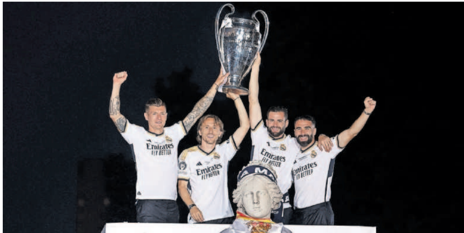
Kroos, Modric, Nacho y Carvajal, los jugadores del actual Real Madrid con seis Champions, anoche en la plaza de Cibeles. CLAUDIO ÁLVAREZ

ños. Los socialistas, por su parte, lograrían el 30,1% de los sufragios y 20 diputados. Vox se consolida como tercera fuerza política de España y sumaría siete representantes. La encuesta se realizó en la semana en que España reconoció el Estado palestino y el Congreso aprobó definitivamente la ley de amnistía. —P14 Y 15