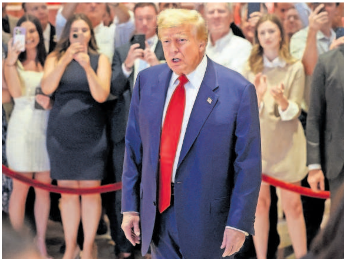
Donald Trump hacia ayer declaraciones en la Trump Tower de Nueva York.

El Ministerio de Consumo ha impuesto una sanción sin precedentes de más de 150 millones de euros a Ryanair, Vueling, EasyJet y Volotea por cobrar un cargo por el equipaje de mano y otros abusos. —P24