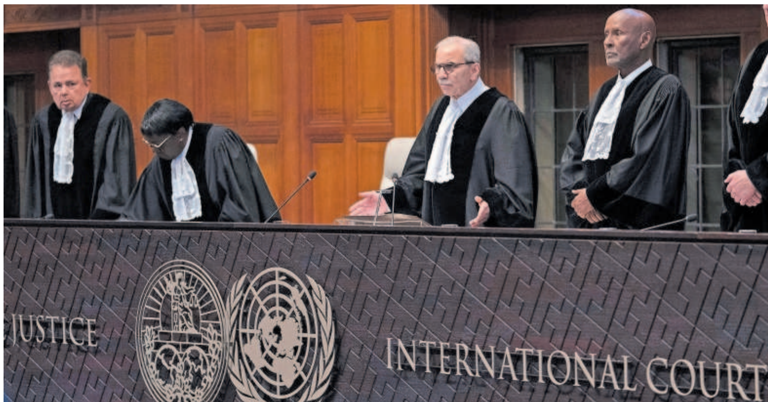
Miembros del tribunal de la ONU, ayer antes de la lectura del dictamen en La Haya.