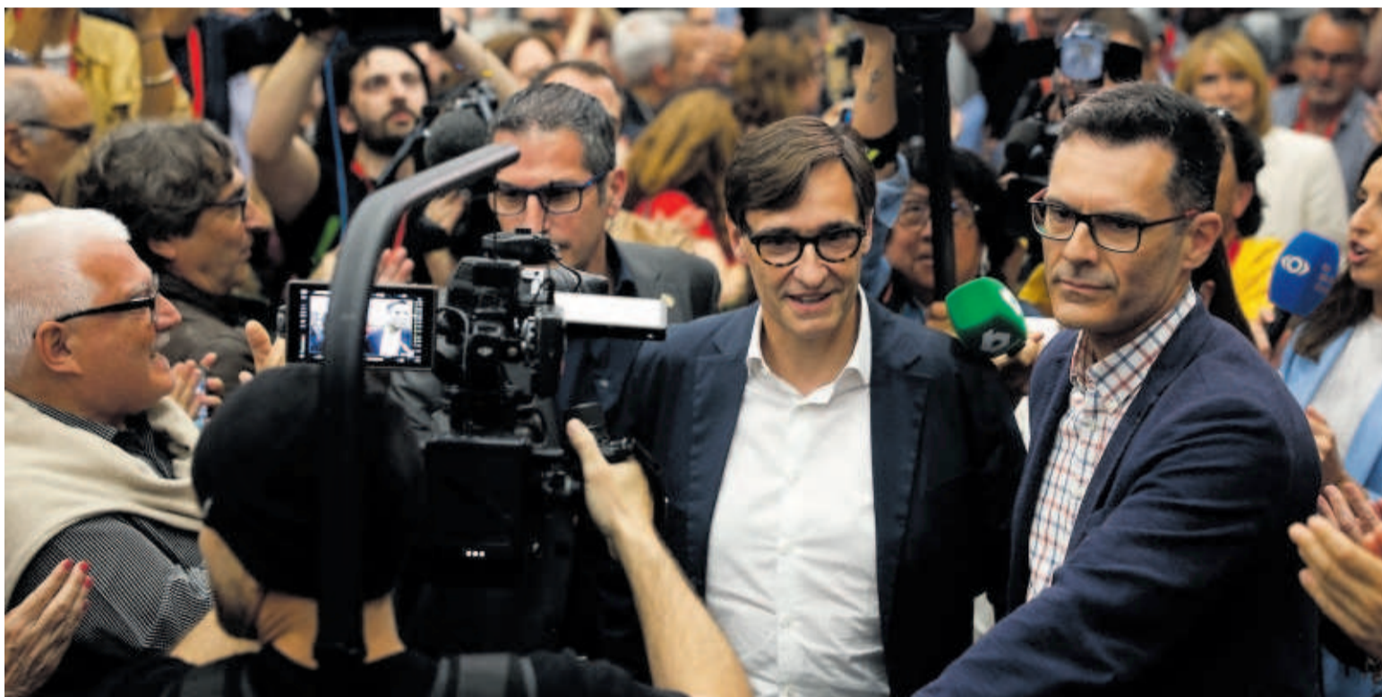
El candidato socialista, Salvador Illa, anoche en Barcelona tras conocerse los resultados electorales.