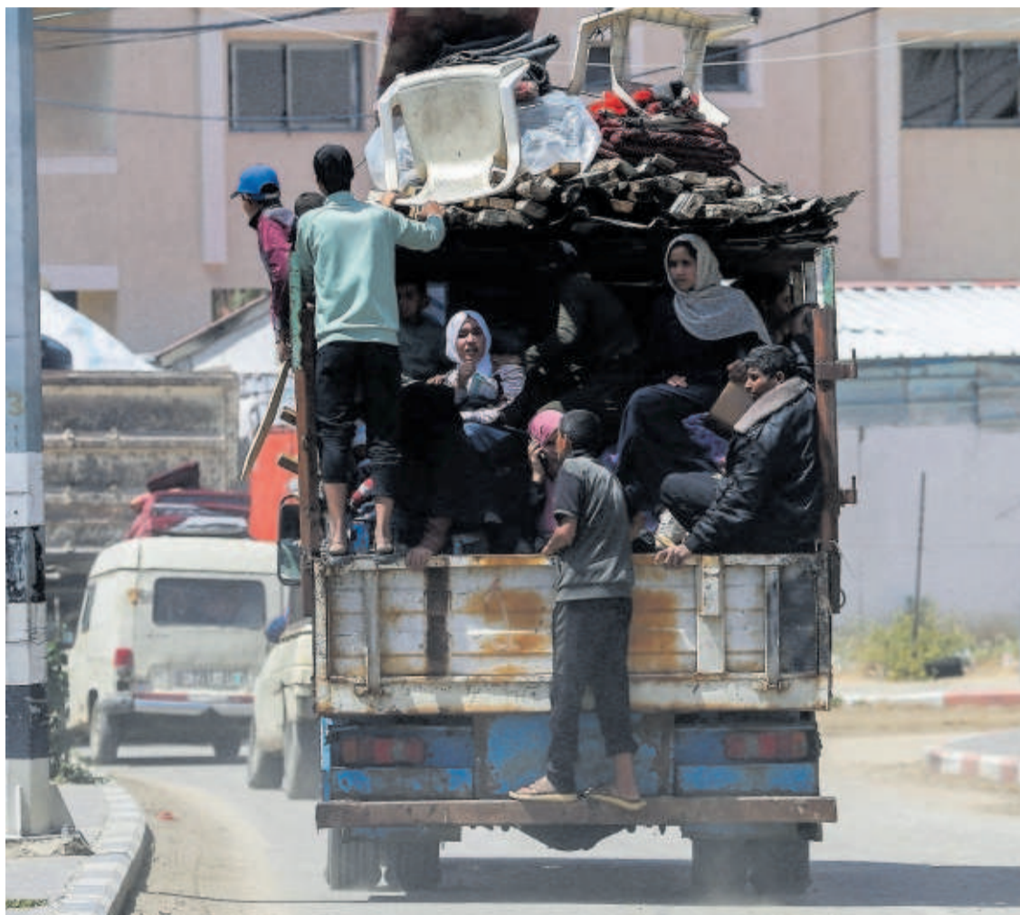
Grupos de palestinos abandonaban ayer Rafah con sus escasas posesiones.

Ábalos niega la trama y se queja del “juicio paralelo” —P21