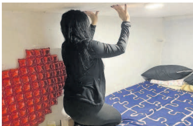
Habitación de una pareja en la que no se puede estar de pie. E. R.

Casi un centenar de muertos en el naufragio de un barco hacinado —P9