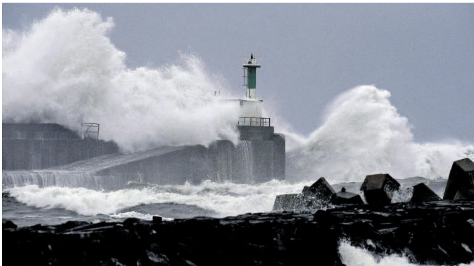
Espigón de San Esteban de Pravia (Asturias), donde un turista británico falleció este jueves tras acercarse a ver las olas.

La dirección mundial de Ford asignará a la fábrica de Almussafes (Valencia), con 4.800 trabajadores, la producción de un vehículo de pasajeros con el que la factoría “mantendrá suficiente carga de trabajo” mientras se decide el futuro de la electrificación. —P22