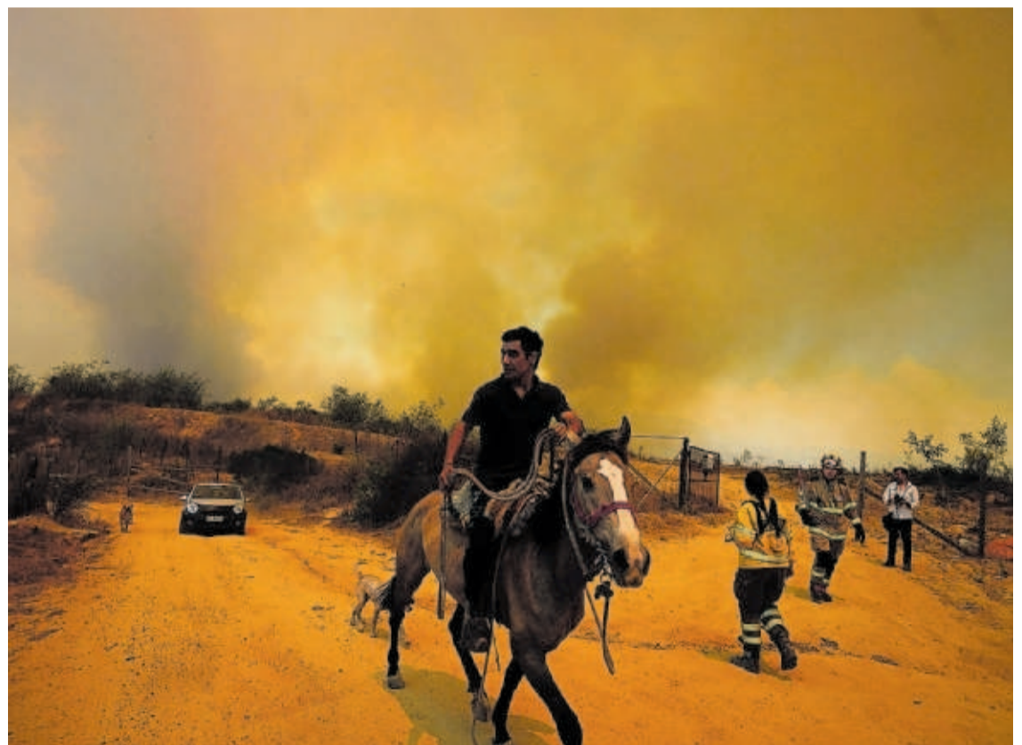
Un fuego devastador en Chile. Los incendios en la zona centro-sur del país han causado al menos 99 muertos. El presidente, Gabriel Boric, dice que es la mayor tragedia en el país desde el terremoto de 2010. En la foto, un vecino huye a caballo de las llamas en Viña del Mar. —P6

ya defendió la Fiscalía de la Audiencia Nacional. El argumento es que no cabe atribuir delitos de terrorismo a los investigados, como pretende el juez Manuel García-Castellón, sino desórdenes públicos graves y daños. —P16