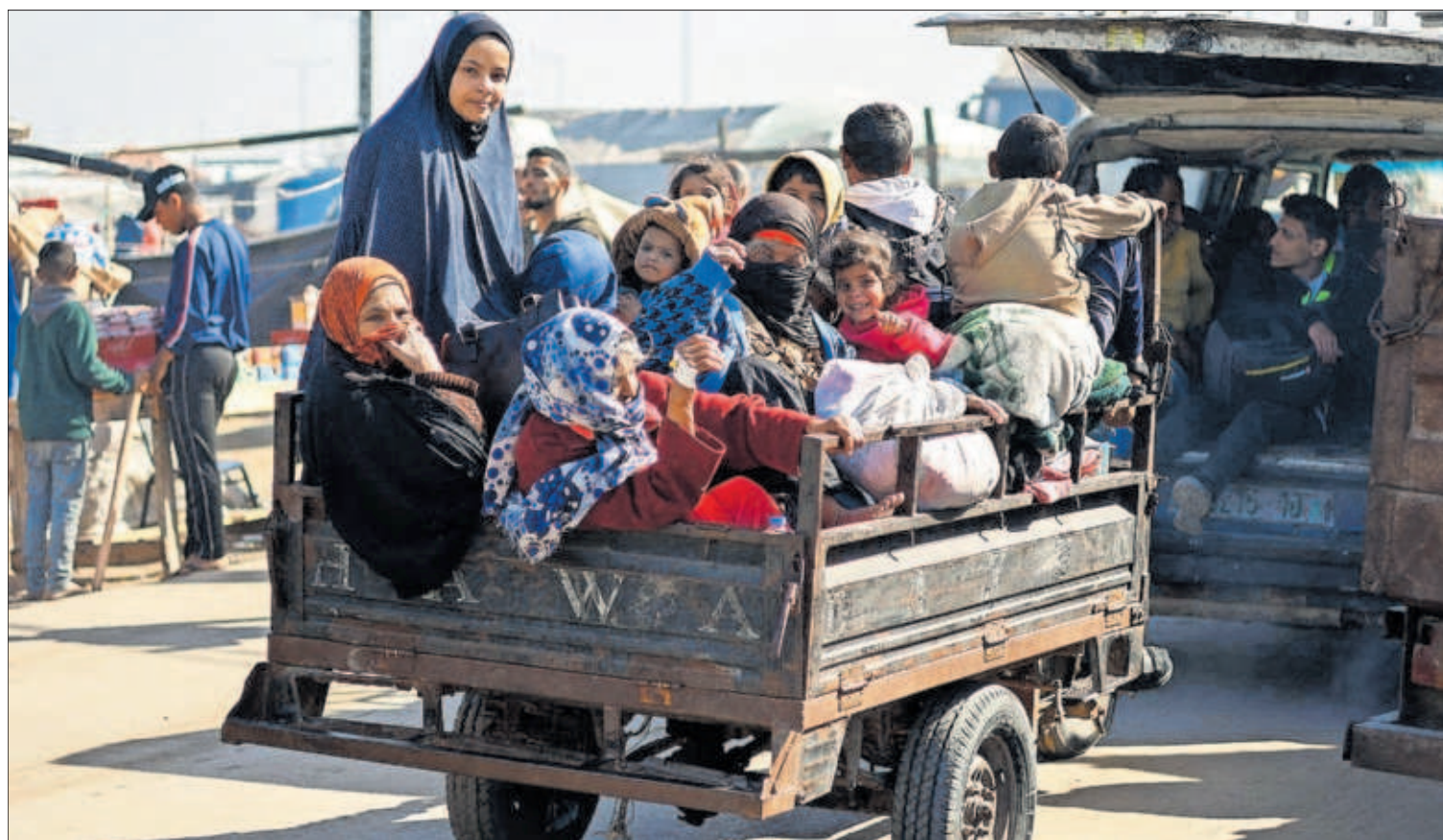
ÉXODO ENTRE LAS BOMBAS DEL SUR DE GAZA. Familias enteras huían ayer en coches y remolques de Jan Yunis, la segunda ciudad de la Franja, hacia Rafah, donde se apiñan ya un millón de personas, al recrudecerse los bombardeos israelíes. PÁGINA 3

PATRICIA ORTEGA DOLZ, Madrid El Servicio de Protección de la Naturaleza (Seprona) de la Guardia Civil ha destapado, en la llamada Operación Anóxica, 74 pozos ilegales con los que un total de 37 agricultores (que han sido imputados) regaban más de 2.000 hectáreas, cuyos fertilizantes presuntamente han ido a parar al mar Menor. Los acusados se enfrentan a penas de entre seis meses y cinco años de prisión. PÁGINA 25