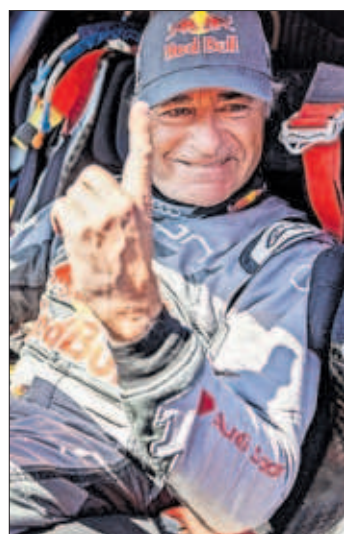
Sainz, ayer tras su triunfo.

El español Carlos Sainz conquistó ayer su cuarto Rally Dakar y batió a los 61 años su propio récord de veteranía en la prueba, celebrada en Arabia Saudí. Fue una victoria incontestable, con más de una hora de ventaja sobre sus rivales, al volante de un prototipo híbrido de Audi con el que compete desde hace tres años. PÁGINA 36