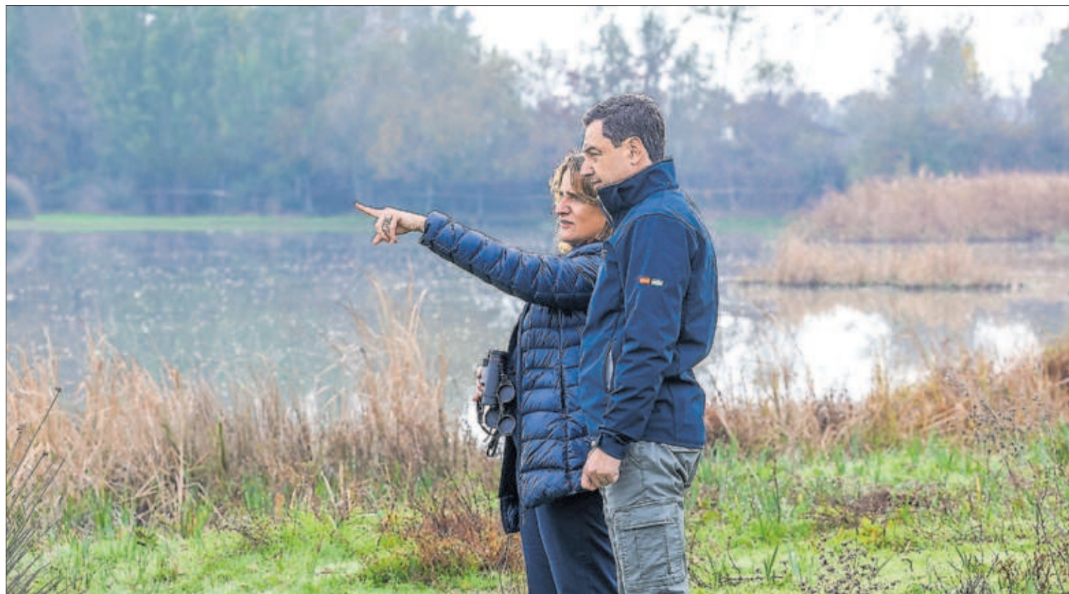
La vicepresidenta tercera, Teresa Ribera, y el presidente andaluz, Juan Manuel Moreno, ayer en el parque nacional de Doñana.

I. VALDÉS / A. PUENTES, Madrid Un hombre de 26 años con denuncias previas fue detenido ayer por asesinar a cuchilladas a su exmujer, de 25 años, y a la hija de ambos, de cinco, en el distrito madrileño de Carabanchel. Y una mujer de 37 años murió en el hospital por las heridas que le causó su pareja al estrangularla, también en Madrid, en el domicilio donde estaban sus hijos, de 2 y 3 años. PÁGINAS 26 Y 27