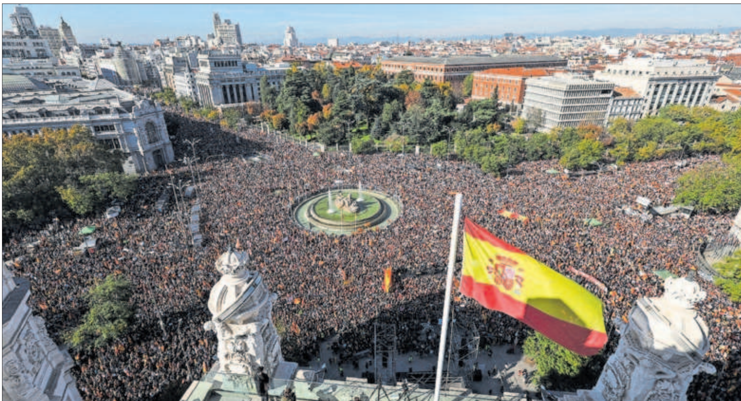
MANIFESTACIÓN MASIVA CONTRA LA AMNISTÍA EN MADRID. Decenas de miles de personas protestaron ayer contra la ley de amnistía, dos días después de la reelección de Pedro Sánchez como presidente. Entre ellos estaban los líderes de la derecha, Alberto Núñez Feijóo y Santiago Abascal, y algunos dirigentes autonómicos del Partido Popular.