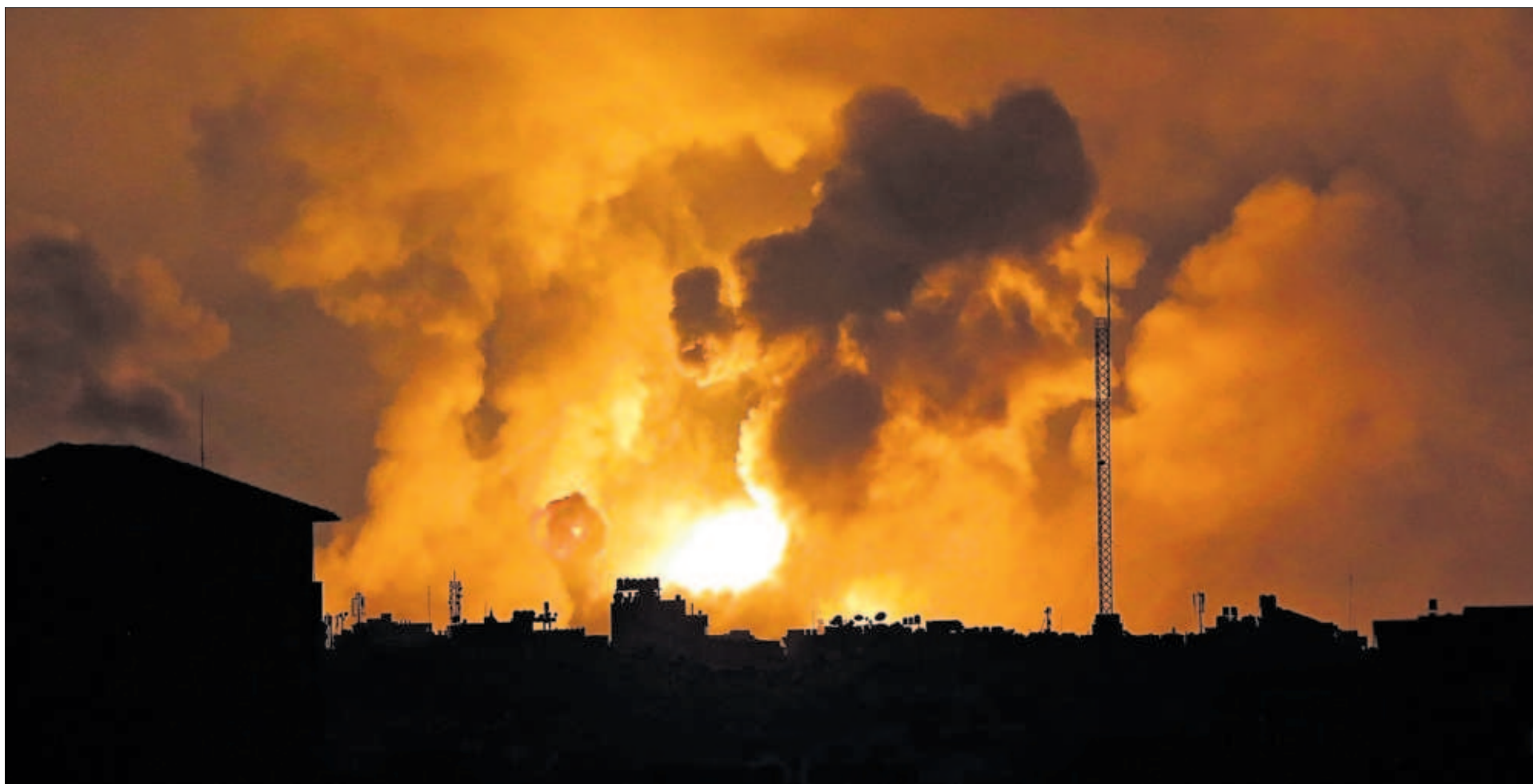
Las explosiones por los bombardeos israelíes, anoche en el norte de la franja de Gaza.