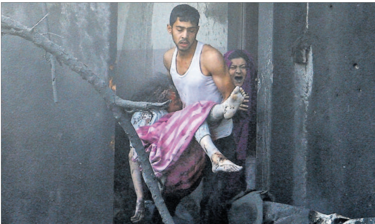
Un hombre lleva a una niña en brazos, herida durante un bombardeo israelí, en Jan Yunis, al sur de Gaza.