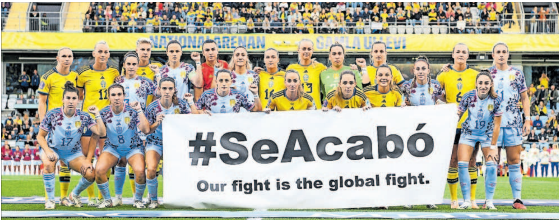
DAVID LIDSTROM (GETTY IMAGES)