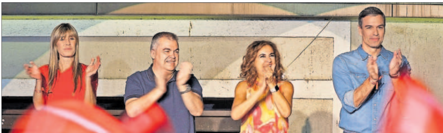
Pedro Sánchez, a la derecha, con su esposa, Begoña Gómez; Santos Cerdá, y María Jesús Montero, en Ferraz.