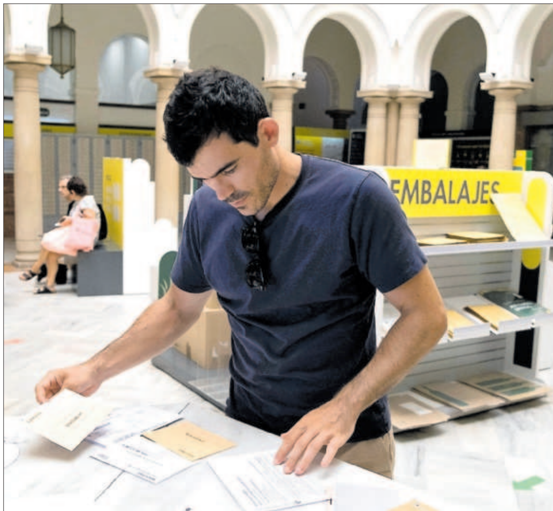
Un ciudadano entregaba ayer su voto en la oficina central de Correos en Sevilla.