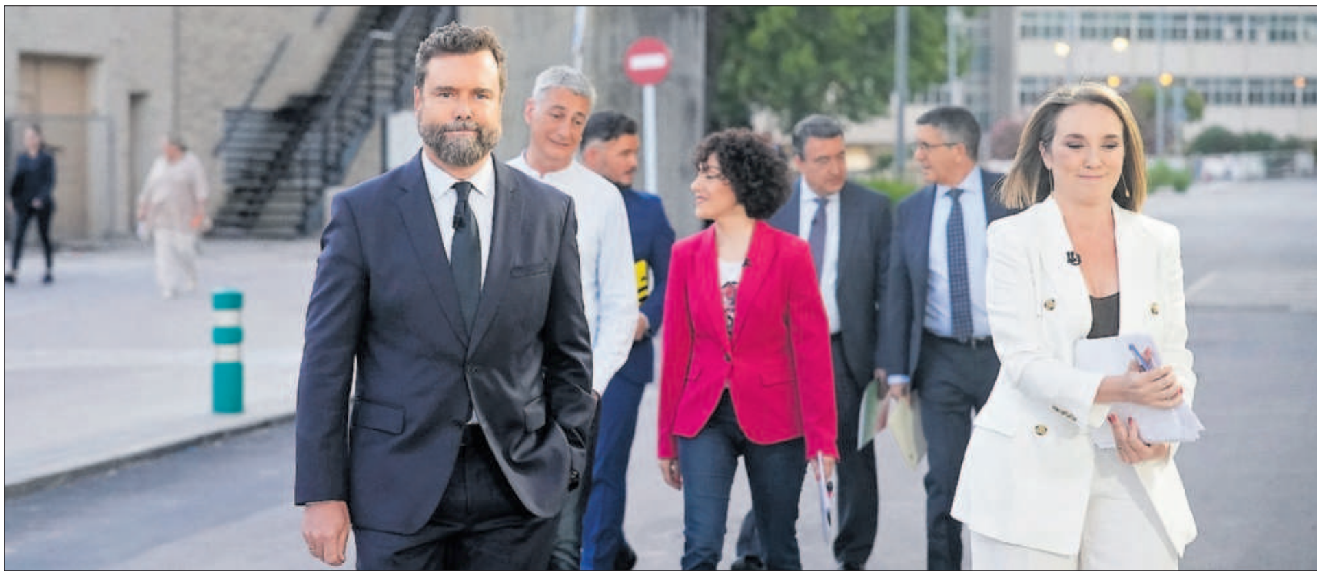
Los portavoces de los siete grupos, a su llegada a los estudios de RTVE para el debate de anoche. Desde la izquierda, delante, Iván Espinosa de los Monteros (Vox) y Cuca Gamarra (PP); detrás, Oskar Matute (EH Bildu), Gabriel Rufián (ERC), Aina Vidal (Sumar), Aitor Esteban (PNV) y Patxi López (PSOE).