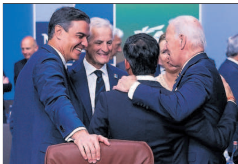
Pedro Sánchez; el primer ministro de Noruega, Jonas Gahr Store; Rishi Sunak, y Joe Biden, ayer en la cumbre de la OTAN.

El Partido Popular Europeo (PPE) no logró ayer tumbar en el Parlamento Europeo la Ley de Restauración de la Naturaleza, que pretende proteger la biodiversidad. La votación, sobre la posición que se negociará con el Consejo de la UE, se saldó con 336 síes, 300 noes y 13 abstenciones. PÁGINA 26