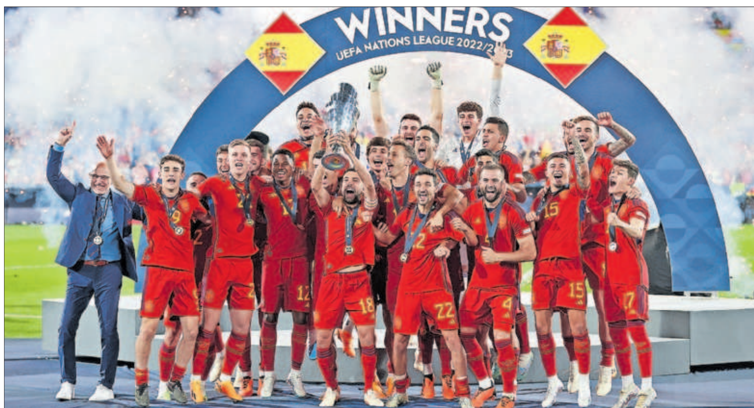
Los jugadores de la selección española celebraban ayer en Róterdam la victoria en la Liga de las Naciones.

MANUEL PLANELLES, Madrid España está camino de incumplir los objetivos europeos de reciclaje de desechos, algo que ya ocurrió en 2020, cuando la tasa de reutilización de las basuras urbanas se quedó en un exiguu 36,4% frente al 50% exigido. La nueva meta de la UE es que en 2025 esta tasa llegue al 55% y los datos que maneja la Comisión Europea apuntan a que España volverá a suspender. PÁGINA 24