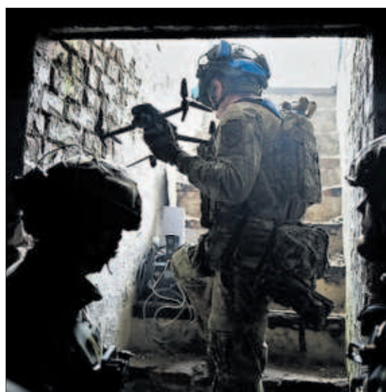
Miembros del Grupo Thor, con un dron.

EL PAÍS, en el frente ucranio con la unidad que lanza las aeronaves