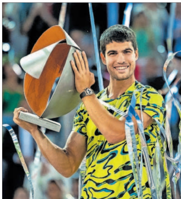
Carlos Alcaraz, con el trofeo del Mutua Madrid Open.

En Madrid, Ayuso avanzaría en 4 escaños hasta los 69, uno más de los necesarios para gobernar en solitario, y Vox repetiría sus 13. PSOE y Más Madrid quedan detrás y en empate técnico, con 26 o 27 asientos, muy lejos de amenazar la hegemonía de la derecha. Las opciones de la izquierda son menores: Podemos-IU queda por debajo del 5%, en un 4,4%, y por tanto fuera de la Asamblea regional. PÁGINAS 14 Y 15