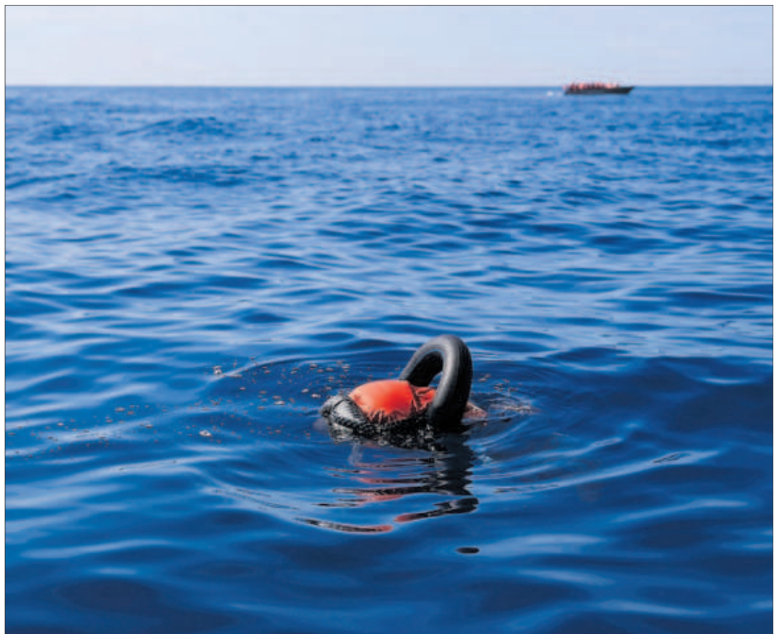
El cadáver de un hombre flotaba en el Mediterráneo, en aguas maltesas, el pasado jueves.

El mundo afronta una masiva transformación del empleo P42