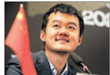
El ajedrecista Liren Ding.

dose al vacío con menos de dos minutos en el reloj en una posición diabólica. Su arrojo paralizó al ruso Ian Niepómniashi, que esperaba tablas. PÁGINA 38