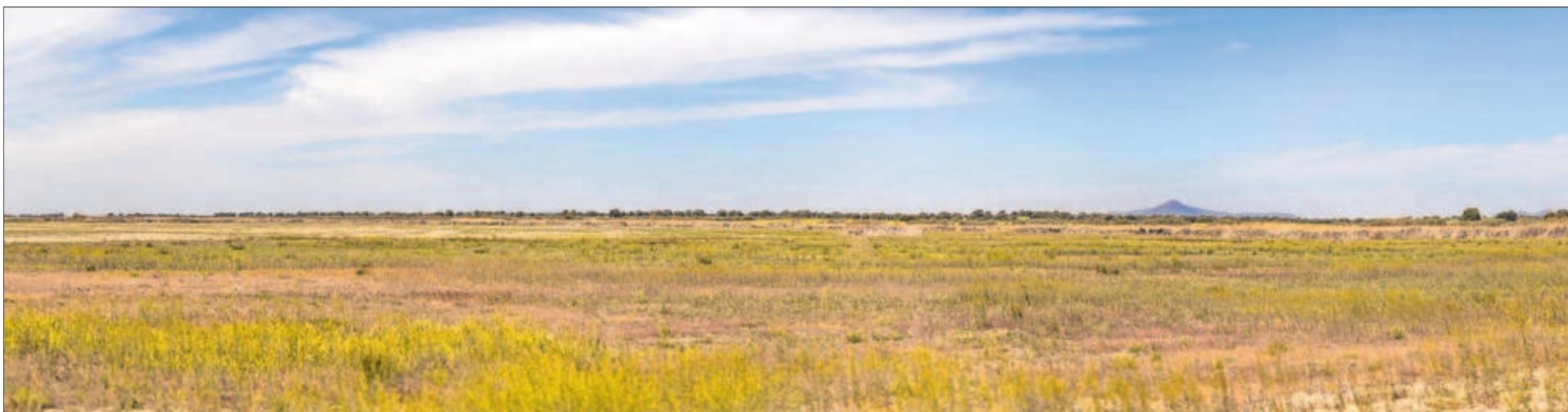
La misma zona de Las Tablas de Daimiel, la última vez que se llenaron de agua, en 2013, y, abajo, el miércoles.