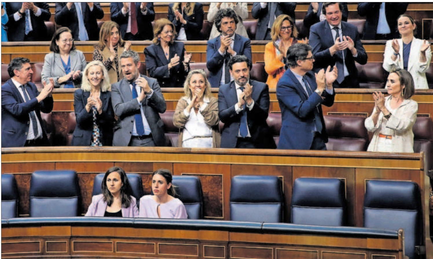
Los diputados del PP festejaban ayer el resultado de la votación detrás de Ione Belarra e Irene Montero, sentadas.