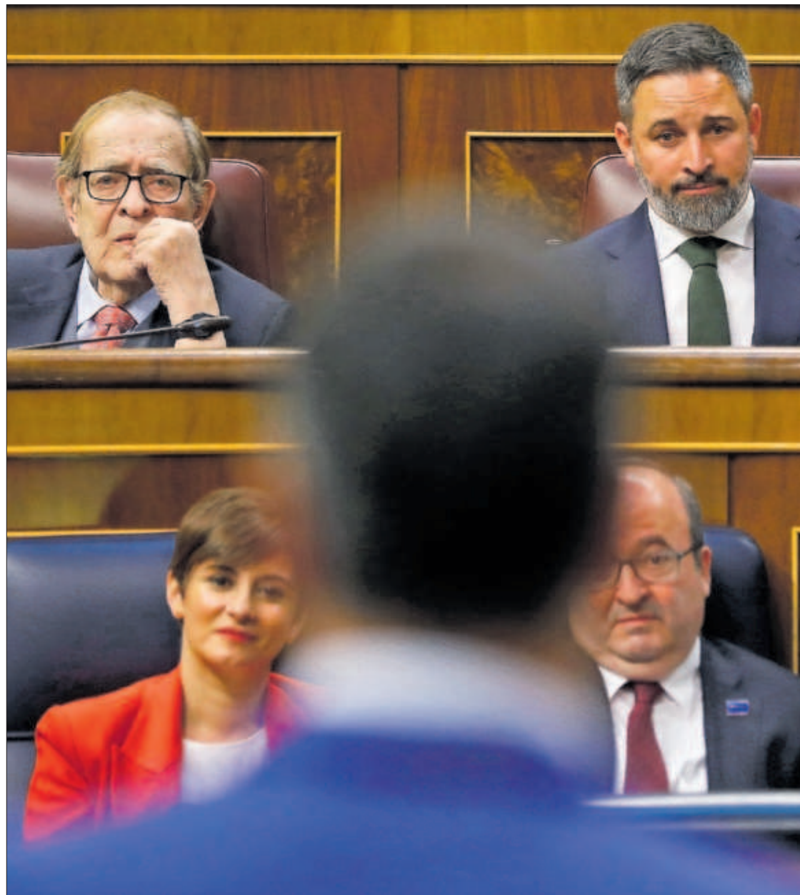
Pedro Sánchez, de espaldas, se dirige desde la tribuna del Congreso a Ramón Tamames y Santiago Abascal; debajo de estos, los ministros Isabel Rodríguez y Miquel Iceta.

La coalición salió reforzada en un debate pensado en teoría para disolverla. Todos los ministros y diputados que apoyan al Gobierno, también los de Podemos, puestos en pie, aplaudieron primero a Sánchez y después a Yolanda Díaz. PÁGINAS 14 A 19