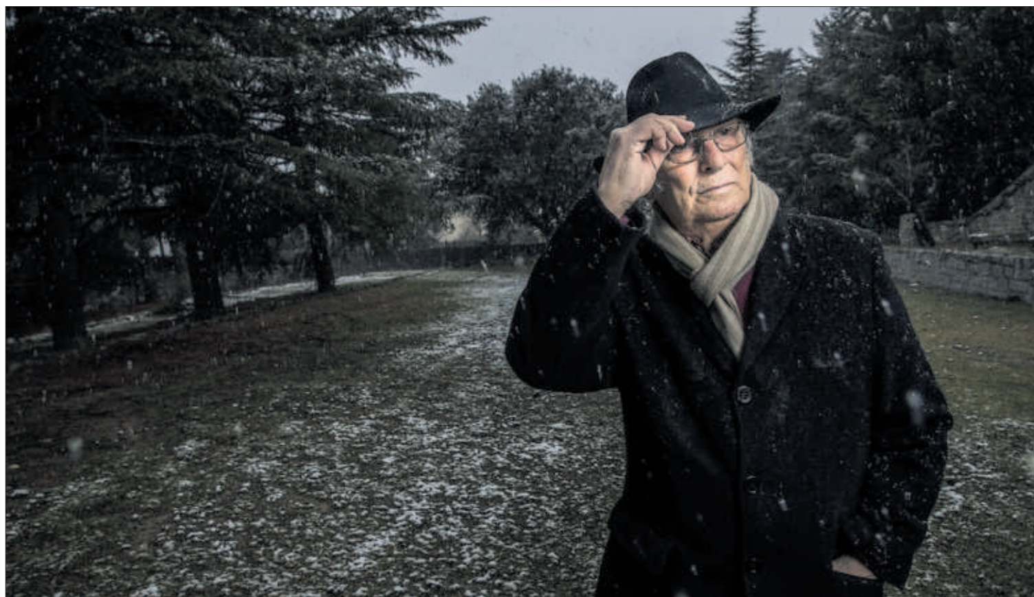
Carlos Saura, en su casa en la sierra madrileña, en una imagen de 2018.

to con el ingente gasto invertido para financiar la guerra en Ucrania, han llevado al gigante euroasiático a registrar su mayor déficit fiscal en un enero desde la caída de la Unión Soviética, en 1991: el equivalente en rublos a 22.400 millones de euros. El recorte del 5% de la producción petrolera anunciado ayer por el Kremlin para estabilizar los precios en caída libre no ayudará. PÁGINAS 38 Y 39