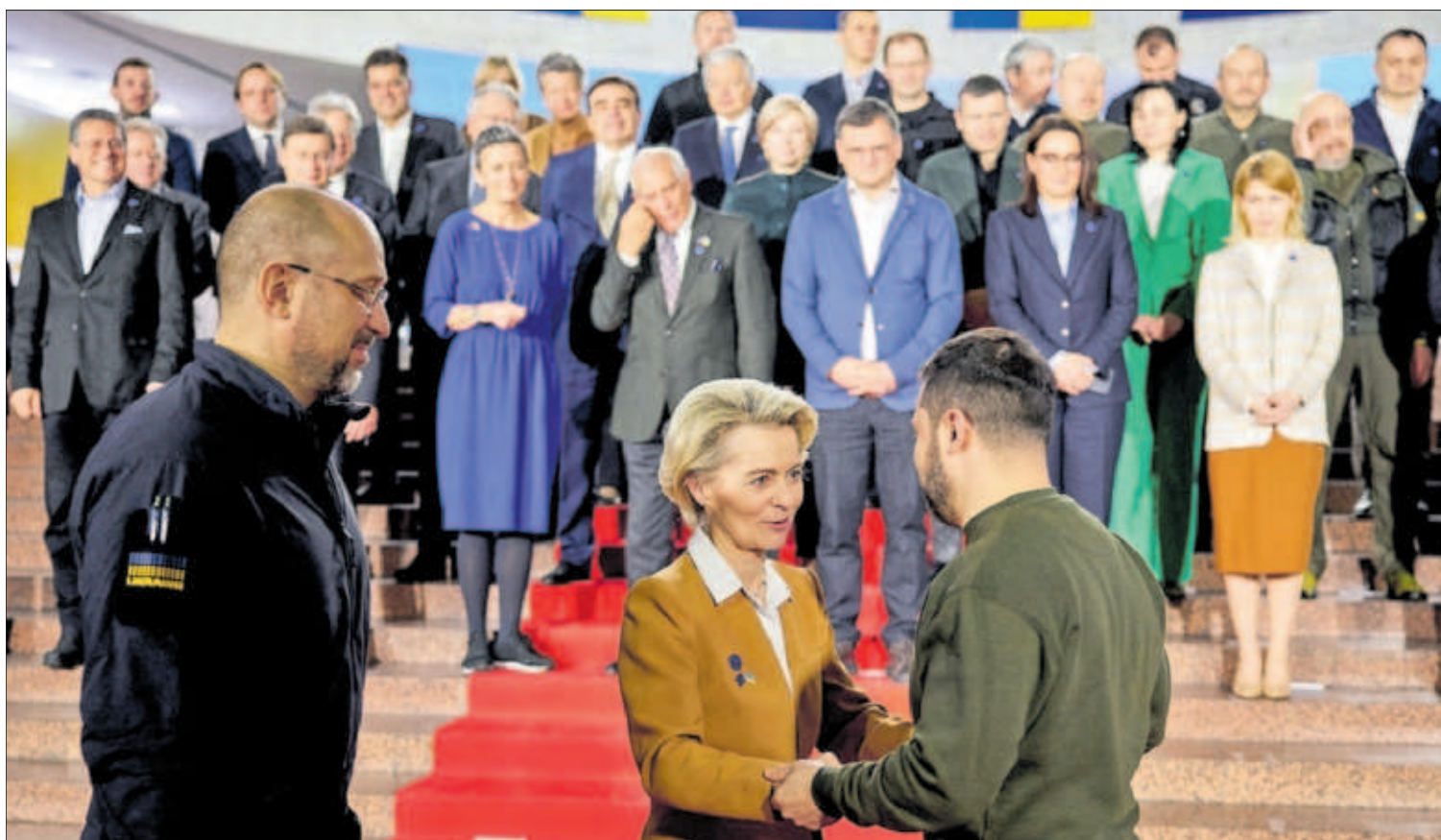
KIEV SE CONVIERTE EN CAPITAL DE LA UE POR UN DÍA. La presidenta de la Comisión Europea, Ursula von der Leyen, y 15 comisarios desembarcaron ayer en la capital de Ucrania para reunirse con su Gobierno en un gesto de gran simbolismo. "El futuro de Ucrania está en la UE", dijo Von der Leyen a Volodímir Zelenski, ambos junto al primer ministro Denís Shmihal en una imagen de la presidencia ucraniana. PÁGINA 2

JOSÉ LUIS ARANDA, Madrid El empleo atraviesa momentos de incertidumbre, como toda la economía. El mes de enero, que tradicionalmente es negativo para el mercado laboral por el fin de la campaña navideña, se saldó con la pérdida de 215.000 afiliados a la Seguridad Social. Pese a este descenso, el número de ocupados se mantiene ligeramente por encima de los 20 millones. El paro subió en 70.744 personas, según los datos difundidos por Trabajo, y el total de desempleados queda en 2,9 millones. PÁGINA 41