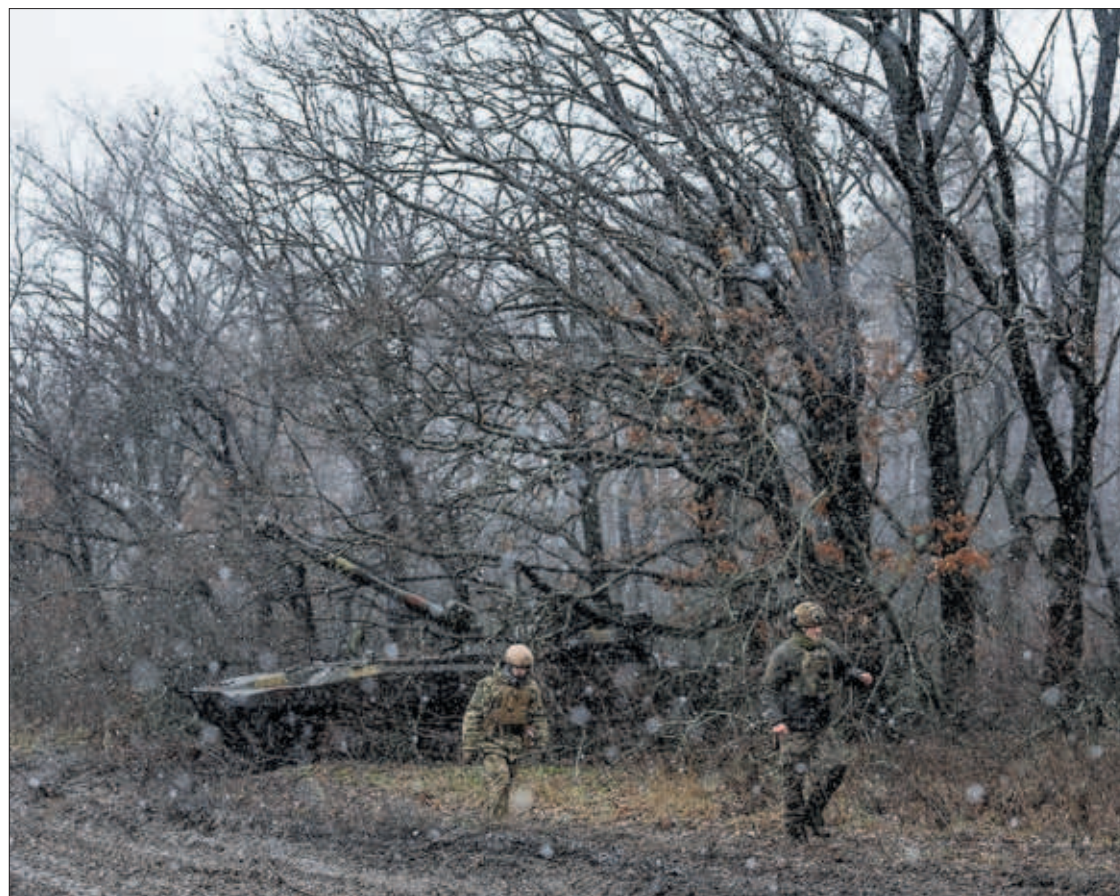
Soldados ucranios caminan ayer bajo la nieve en la zona de Kremina (Lugansk).