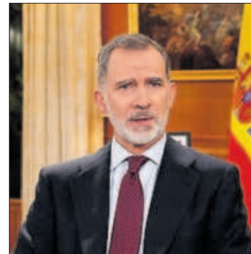
Felipe VI, durante su discurso.

a las 141 entidades, entre órdenes y diócesis. Un mes después, sólo el 13% aportó escasa información. Mientras, las víctimas se sienten desatendidas por los tribunales eclesiásticos. PÁGINAS 24 Y 25